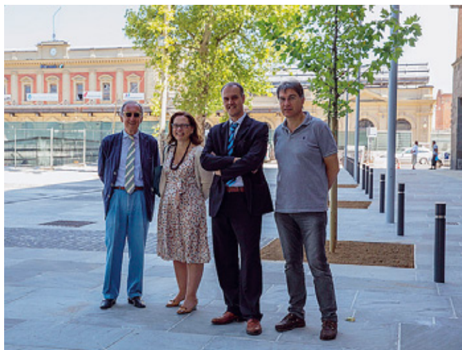
Pedonale In alto una vista del piazzale; qui sopra un momento dell'inaugurazione e il «balcone» sul cantiere.