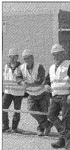
Alcuni addetti ai lavori

CATANZARO - La superficie complessiva dell'area a Germaneto destinata alla cittadella regionale si estende per oltre 190.000 metri quadrati e ospiterà un complesso edilizio a forma di "C", composto da tre edifici di cui due a "corpo doppio" ed il terzo a "corpo triplo" che si sviluppano su nove o undici piani, a cui si aggiunge un piano seminterato. Il complesso nel suo insieme ospiterà la presidenza, gli assessorati e gli uffici operativi della Regione per un totale di 1600 postazioni di lavoro. Accanto agli uffici, la sede ospiterà - tra l'altro secondo quanto previsto - un Centro Elaborazione dati, magazzini e archivi, uffici di relazione con il pubblico e ben cinque sale per conferenze di diversa capienza. Sono, inoltre, previsti ampi spazi museali nei quali saranno collocati gli importanti reperti