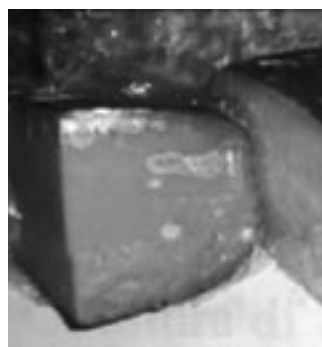
Alcuni alimenti mal conservati trovati durante i controlli

Oltre ai ripiani di lavoro sporchi e alla cucina evidentemente non troppo in ordine, gli addetti Ausl si sono accorti che nei bagni