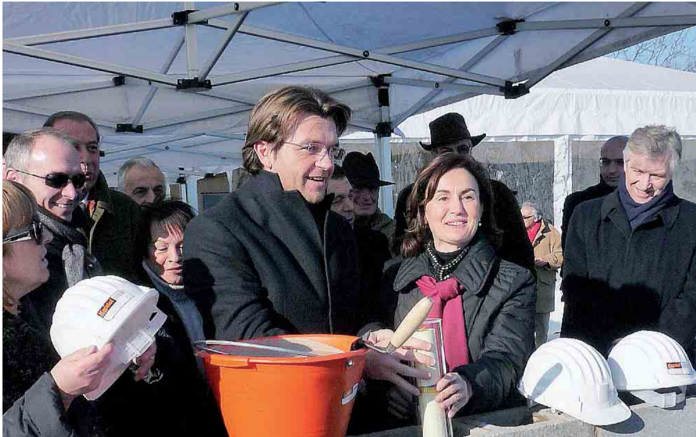
Il sindaco Vignali e il direttore dell'Efsa Catherine Geslain Lanéelle durante la posa della prima pietra della Scuola Europea

Dopo spiegazioni tecniche e dichiarazioni, è stata la volta delle foto di rito con il sindaco, la direttrice dell'Efsa e quella della Scuola per l'Europa che con cazzuola in mano stendono il primo simbolico strato di cemento del complesso. Della prima pietra nemmeno l'ombra: ma in queste occasioni, si sa, è il pensiero che conta. E per il vero taglio del nastro mancano ancora 18 mesi.