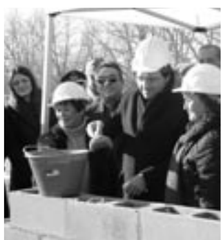
La posa della prima pietra

Sette gli edifici in tutto, riuniti da un chiostro pensato per garantire percorsi coperti fra le varie strutture e per dare un senso di unitarietà al progetto. Ogni ciclo scolastico