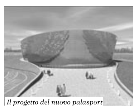
Il progetto del nuovo palasport

mentazione presentata e quindi si riunirà in seduta pubblica per l'apertura delle buste contenenti le offerte economiche. La struttura, che sorgerà a Moletolo, occuperà un'area di circa 9mila metri quadrati e sarà in grado di ospitare fino a 7.500 spettatori. L'edificio si svilupperà su una altezza di 21 metri e una larghezza di 100 metri. "E' il primo tassello verso la Cittadella dello Sport - afferma il sindaco Pietro Vignali - Prossimo passo verso la realizzazione definitiva dell'opera sarà la realizzazione della Cittadella del Rugby". (Pi.zav)