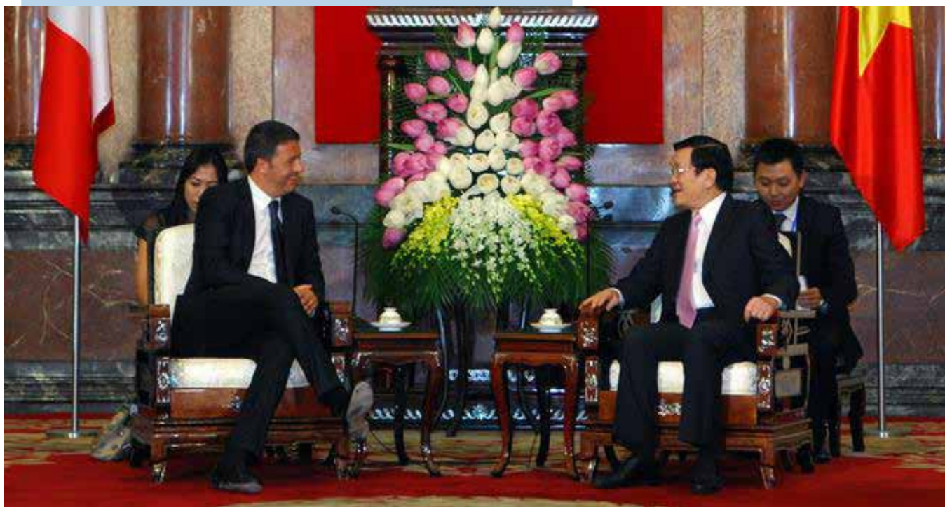
Matteo Renzi a colloquio con il Presidente vietnamita Truong Tan Sang

Paesi è in atto un programma di partenariato strategico. Coinvolge in primo luogo l'interscambio economico , che attualmente ammonta 3,8 miliardi di dollari . L'obiettivo è di farlo crescere a 5 miliardi di dollari entro il 2016 . In quali settori per quanto riguarda le importazioni