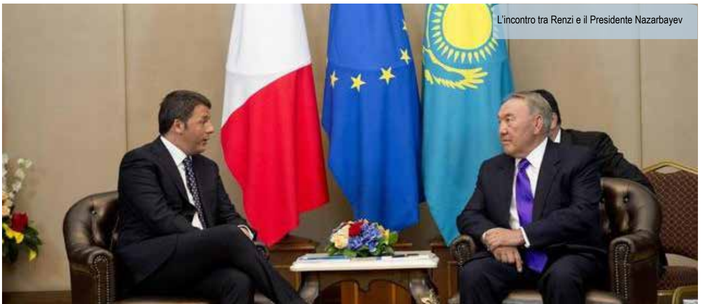
L'incontro tra Renzi e il Presidente Nazarbayev

1.330 miliardi di m3 di gas naturale. Inoltre partecipa con una quota del 16,5% al consorzio ( North Caspian Operating Company ) che gestisce le operazioni del giacimento gigante di Kashagan, considerato il quinto al mondo per volume di riserve (13 miliardi di barili di petrolio). La difficoltà risiede nel forte ritardo nell'avvio della produzione commerciale (e quindi degli introiti attesi dal Governo kazako) a causa delle rilevanti difficoltà tecniche del giacimento: pressioni molto forti, elevato contenuto di acido solfidrico, clima estremamente rigido nella stagione invernale. Attualmente la Saipem dell'Eni è impegnata a risolvere i problemi che sono sorti nel