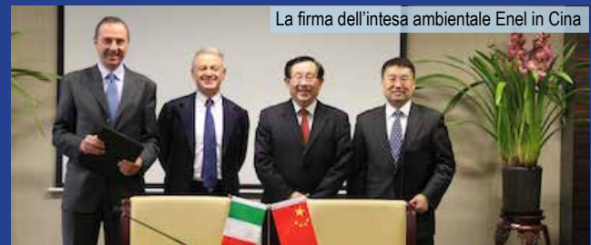
La firma dell'intesa ambientale Enel in Cina