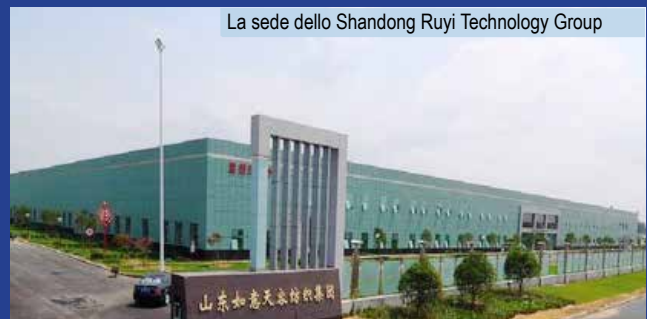
La sede dello Shandong Ruyi Technology Group

Pudong Development Bank. Sace sarà a sua volta riassicurata con Sinasure, agenzia di credito all'esportazione cinese. Infine Sace ha stipulato un accordo di cooperazione con Shandong Ruyi Technology Group, gruppo cinese del settore tessile, per rafforzare le opportunità di business con imprese italiane fornitrici di macchinari e materiali per l'industria del tessile.