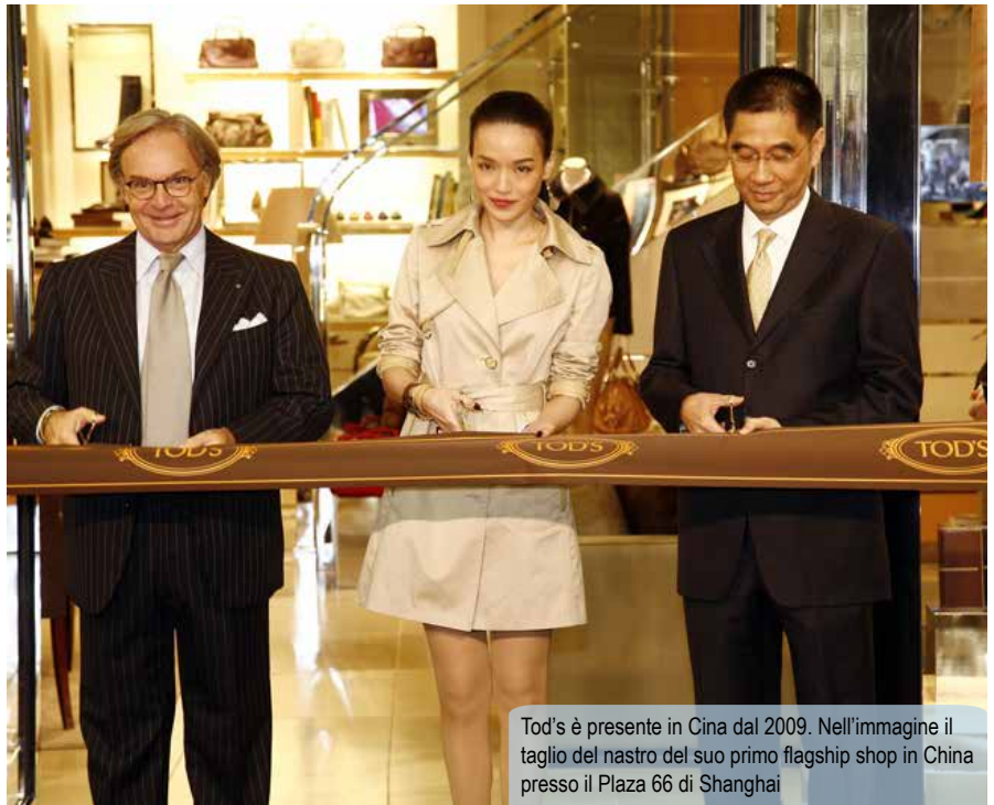
Tod's è presente in Cina dal 2009. Nell'immagine il taglio del nastro del suo primo flagship shop in Cina presso il Plaza 66 di Shanghai

delle convenzioni sociali (oggi l'esibizione della ricchezza non è più considerata poco decorosa come in passato) sono attratti soprattutto dai beni di lusso. In questo contesto, la Cina è attualmente uno dei maggiori importatori di prodotti italiani di fascia medio-alta dei settori alimentari, arredamento, abbigliamento, occhialeria e gioielleria ( cosiddetti beni belli e ben fatti, BBF ).