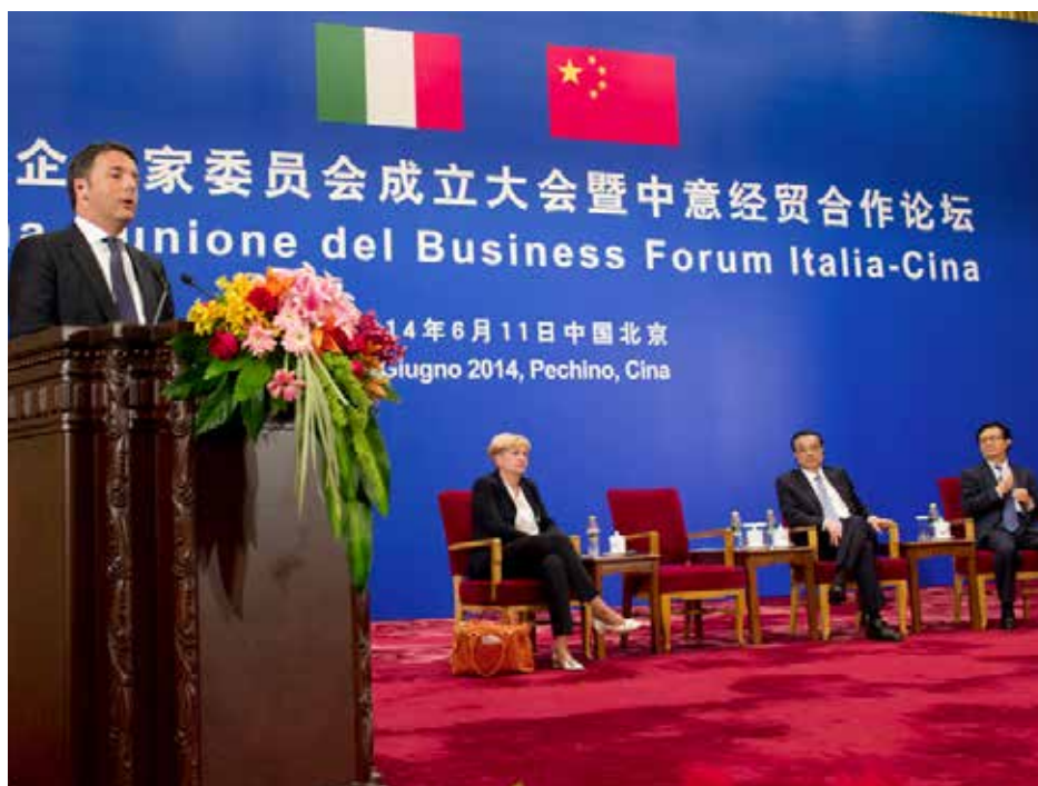
Il Presidente del Consiglio Matteo Renzi al Forum Italia-Cina

La Missione di Sistema in Asia del Presidente del Consiglio Matteo Renzi, accompagnato da numerosi imprenditori, indica una forte accelerazione in direzione di un rilancio di immagine e di prospettive per il Sistema Italia, a partire da un mercato strategico come quello cinese. Era da molti anni infatti che l'Italia non riceveva un'attenzione così rilevante dalle massime Autorità e dalle grandi imprese di quel Paese. Innovativo anche l'approccio fortemente focalizzato su contenuti operativi in termini di business e i risultati non sono mancati. Il successo è stato possibile anche grazie all'intenso lavoro di preparazione da parte dei soggetti pubblici e privati che partecipano alla Cabina di Regia per l'Internazionalizzazione. Sul piano istituzionale è di grande rilievo l'impegno formalmente assunto dalle Autorità di Pechino di riequilibrare, almeno in parte, il forte deficit commerciale nei confronti della Cina identificando, di comune accordo con il Governo italiano, anche i principali settori di attività dove questa azione si potrà concentrare. Tocca ora alle nostre imprese e alle nostre Istituzioni tradurre questa importante apertura in una strategia dotata di adeguati strumenti di supporto sul piano finanziario e organizzativo.