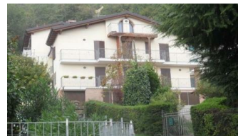
Appartamenti Via San Geminiano n. 814 - 49600